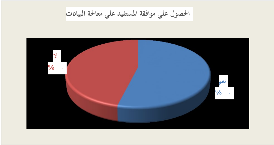
شكل رقم (2) الحصول على موافقة المستفيد على معالجة البيانات

الموافقة مع المادة رقم (2) من القانون رقم (151) لسنة 2020 بشأن حماية البيانات الشخصية. (قانون رقم (151) لسنة 2020، المادة رقم 2، ص. 6) مقابل أربع مكتبات أخرى لا تحصل على تلك الموافقة.